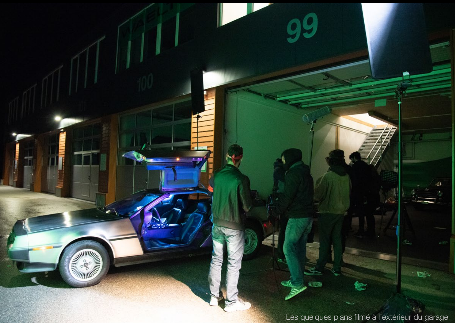
Les quelques plans filmé à l'extérieur du garage

C'est en partie ce qui a donné les limites technique de notre projet.