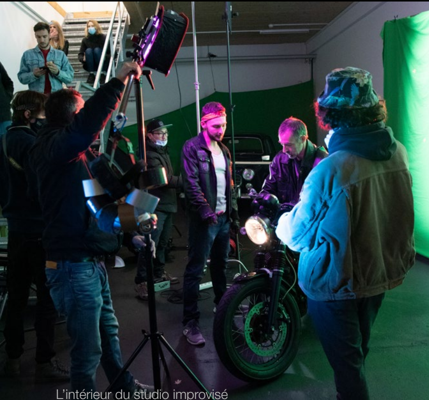
L'intérieur du studio improvisé

J'ai ouvert un fichier word, écrit une toute nouvelle histoire, contacté mes amis, trouvé une maquilleuse, loué du matériel technique et bataillé pour trouver une DeLorean à louer. Cinq jours plus tard, la caméra tournait et nous étions prêts.